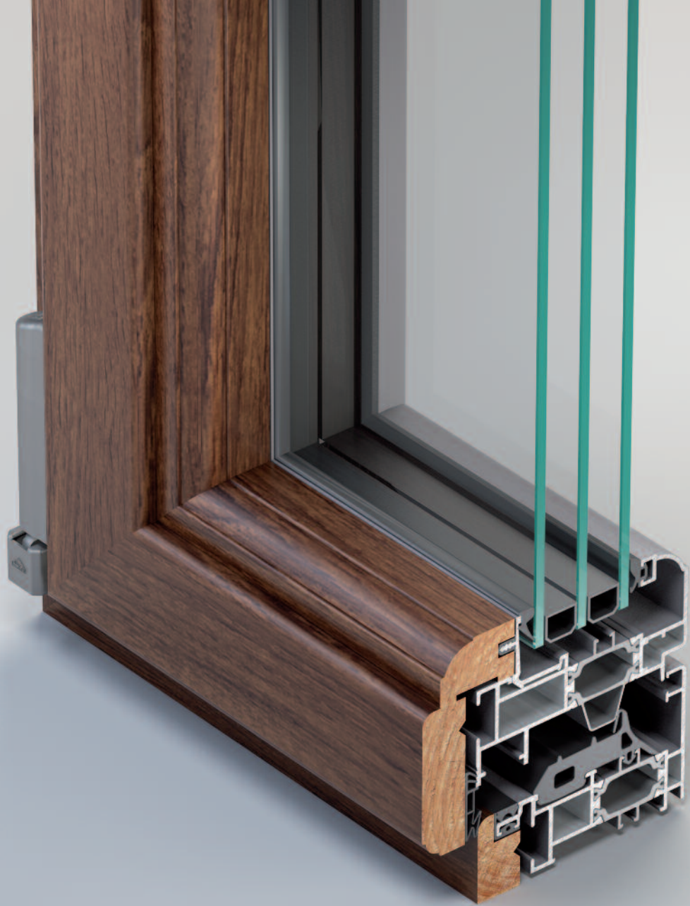
Finestre e porte in Alluminio-Legno